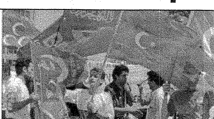
Az sayıda kişinin katıldığı mitingte gençler çoğunluktaydı...

Balkan Türkleri Dayanışma ve Kültür Derneği, Batı Trakya Türkleri Dayanışma Derneği ve Göçmenlere Yardım Derneği ile ANAP, DYP, RP, MHP ve BBP'nin katılımıyla düzenlenen Yunanistan'ı protesto mitingi, 21 Temmuz'da Şişli Abide-i Hürriyet meydanında yapıldı. "Rüzgar eken fırtına biçer", "Papandreu sabrımızı taşıma", "Batı Trakya'daki azınlık Türktür, Türk kalacaktır", "Yunan efendisiz yaşamayı öğrenemediye efendiliğe hazırız" gibi çeşitli pankartların taşındığı mitinge katılım az oldu. Yaklaşık 300 kişinin katıldığı gösteride MHP ve BBP yanlısı gençler çoğunluğu teşkil ediyordu. Devamı 3'te