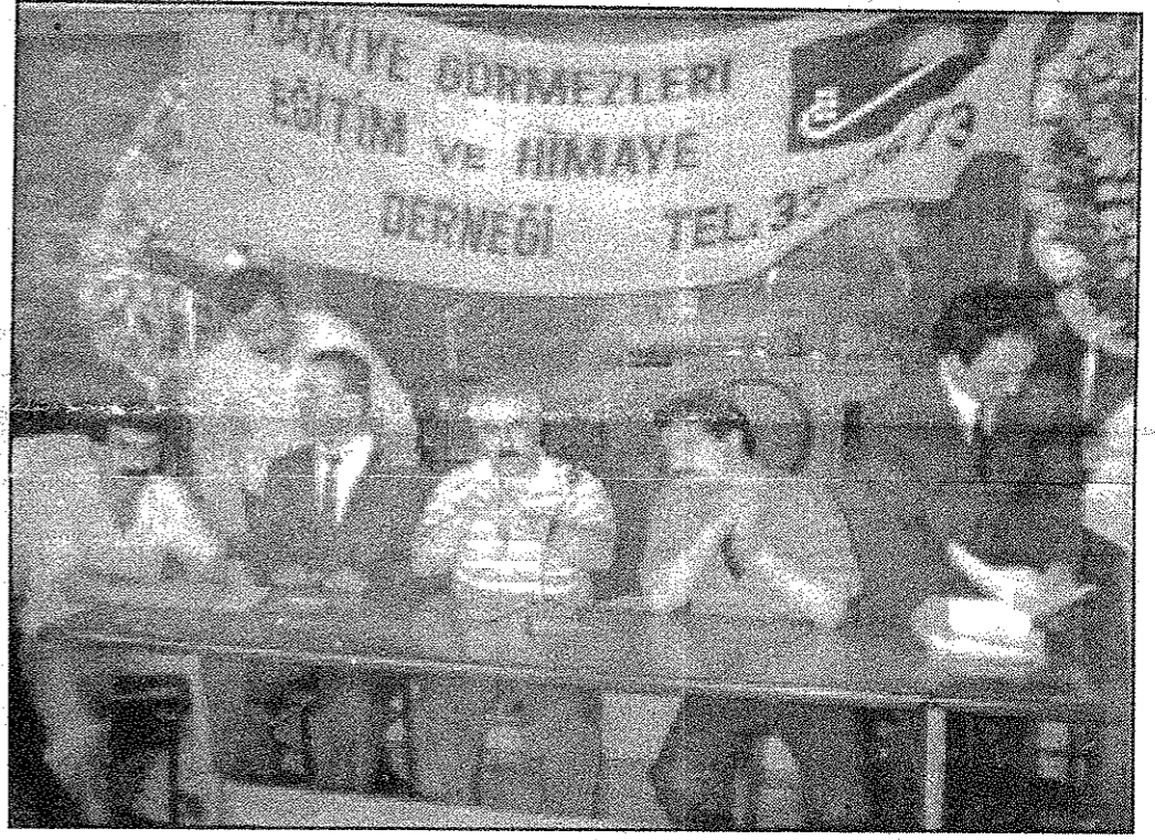
Derneğimiz 25 yıldır görmeyenlerin diğer sorunları için olduğu gibi işsizlik probleminin çözümü için de mücadele veriyor...

Öte yandan Türkiye Görmezleri Eğitim ve Himaye Derneği İstihdam Sekreterliği'ne konuya ilişkin bir açılış yapılarak şu görüşlere yer verildi: Türkiye Görmezleri Eğitim ve Himaye Derneği üyesi olan ve iş bulabilmek