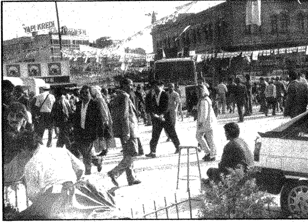
Partilerin ateşli, vatandaş sakin...

Bir seçim dönemi geride kaldı. Mitingler, nutuklar, televizyon konuşmaları, alkışlar, sloganlar, afişler, bildiriler vs. ile kansız ama cansız olmanın bir kampanya dönemi yaşadık. Yolda birbirlerine rastlayan parti konvoyları dostane selamlaştılar, bayraklar sallandı, karşılıklı başarı dileklerinde bulunuldu. Futbol seyircilerinin bile, sporu eğlenceli bir mücadele ve centilimce bir yarış olmaktan çıkararak hırçın tutumları gözününe getirildiğinde, yaşadığımız "olaysız" seçim mücadelesinin bir "politik olgunluk" işareti olduğunu kolaylıkla söyleyebiliriz. Liderlerin ve halkın zorbalık iste ve görünümlerine prim vermemesi, asil kayda değer "olay" dı.