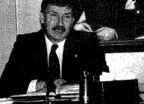
"Biz vicdanlara hükmetmiyoruz, yaptıklarımız ortadadır. Halk buna kendisi karar verecek..."