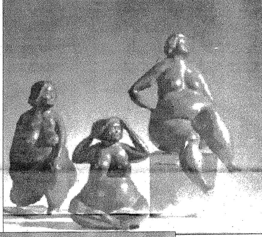
Leyla Aktaş'ın modern eserlerinden biri.