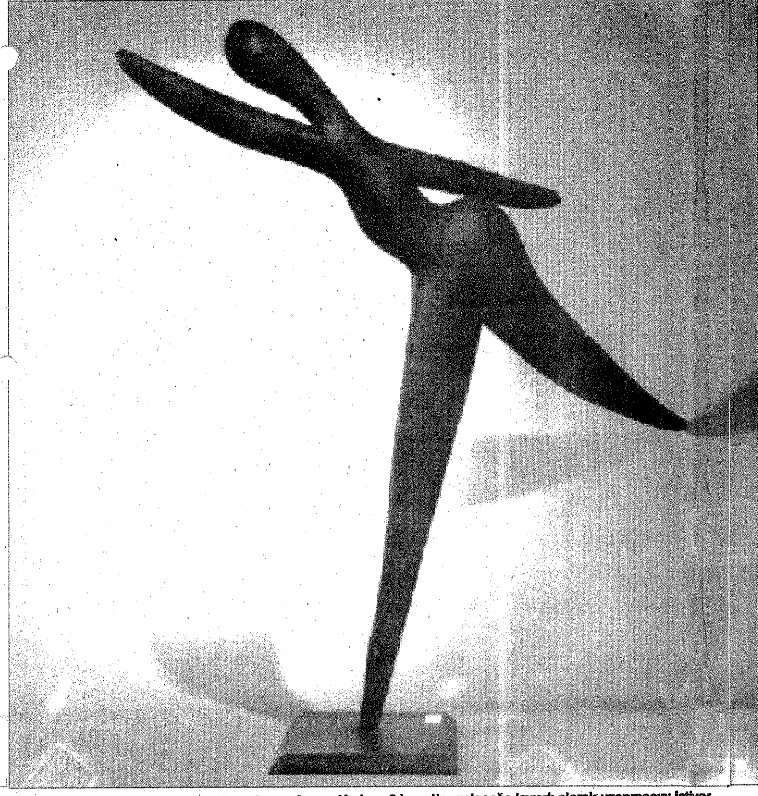
Leyla Aktaş Kadın figürüne ivme kazandırmış. Kadının 3 boyutta, geleceğe kararı olarak uzanmasını istiyor.

■ Leyla Aktaş Rosenberger'e çalışmalarında başarıları diliyor ve sergilerinden birini de Türkiye'de açmasını öneriyoruz. Çünkü yapıtlarının özelliği ile bütünleşen haklı şöhretini kendisiyle paylaşmayı kendi halkının da isteğini düşünüyoruz.